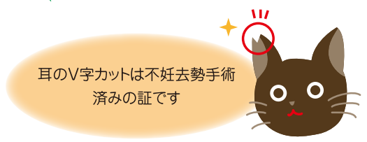
耳のV字カットは不妊去勢手術済みの証です

「地域猫活動」は、地域ぐるみで行う活動という特徴から、単に猫問題の解決にとどまらず、地域のコミュニケーションが活発になるという効果が期待できます。